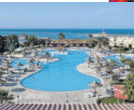
Cluburlaube sind in Ägypten noch immer günstig zu haben.

Beste Reisezeit ist November bis März. Während des Hochsommers wird es sehr heiß. Buchung in Ihrem Reisebüro oder unter ☎ Tel: 01 347 95-0 info@detur.at, www.detur.at